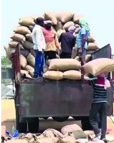
హైదరాబాద్ రాష్ట్రంలో యాసంగి సీజన్లో వస్తున్న వడ్లలో నన్నాలకు పక్క రాష్ట్రాల్లో డిమాండ్ బాగా ఉంది. మరీ ముఖ్యంగా కర్ణాటకలోని కొన్ని జిల్లాల్లో డిమాండ్ ఎక్కువగా ఉంది. తెలంగాణ రాష్ట్రంలో అయితే నారాయణపేట, గద్వాల జిల్లాలతో పాటు నిజామాబాద్ జిల్లాలోని బోధన్ నియోజకవర్గంలో పండించిన సన్న ధాన్యాన్ని అధికంగా కర్ణాటక వ్యాపారులే పెద్ద ఎత్తున కొనుగోలు చేస్తున్నారు. అంతేకాదు మహబూబ్ నగర్, వికారాబాద్ జిల్లాల్లోనూ ఇదే పరిస్థితి. ప్రస్తుతం - మగతా3లో