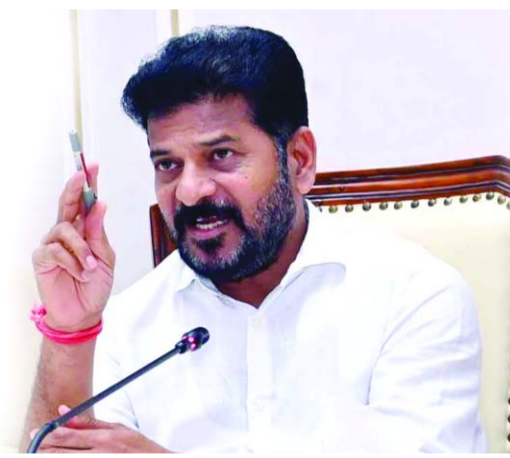
హైదరాబాద్ లో ఆర్డర్ తో ముడి పడి ఉన్న ఈ శాఖ ఎంతో ఇంపార్టెంట్ గా ఉంటుంది. రాజకీయంగా కూడా ఈ శాఖకు ఉన్న గ్రామర్ వేరుగా ఉంటుంది. ఒక విధంగా చెప్పాలి అంటే హోం మంత్రి అంటే వెయిటింగ్ లీస్ట్ మినిస్టర్ అని గతంలో చెప్పుకునే వారు. సీనియర్ మోస్ట్ లీడర్ కి ఈ శాఖ - మగతా3లో